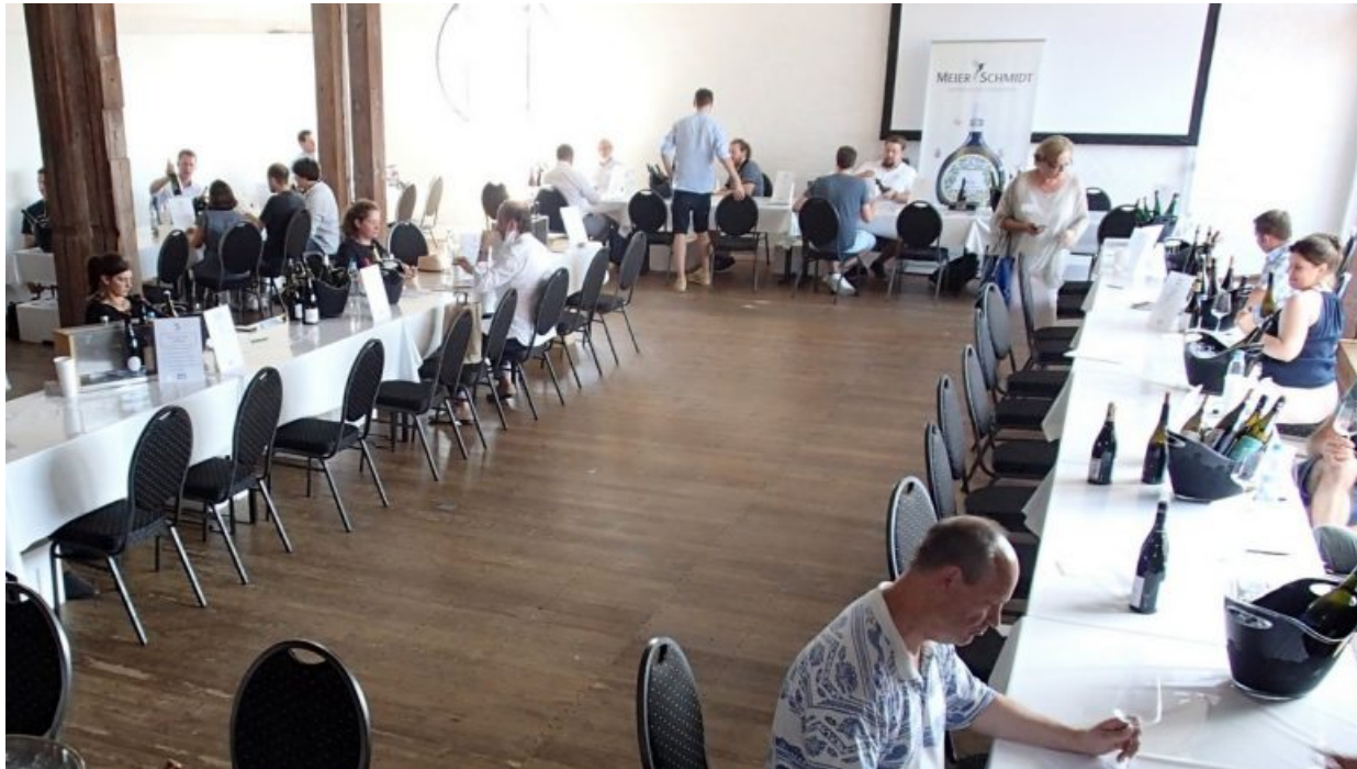
Weintasting im Kaispeicher auf Deck 10